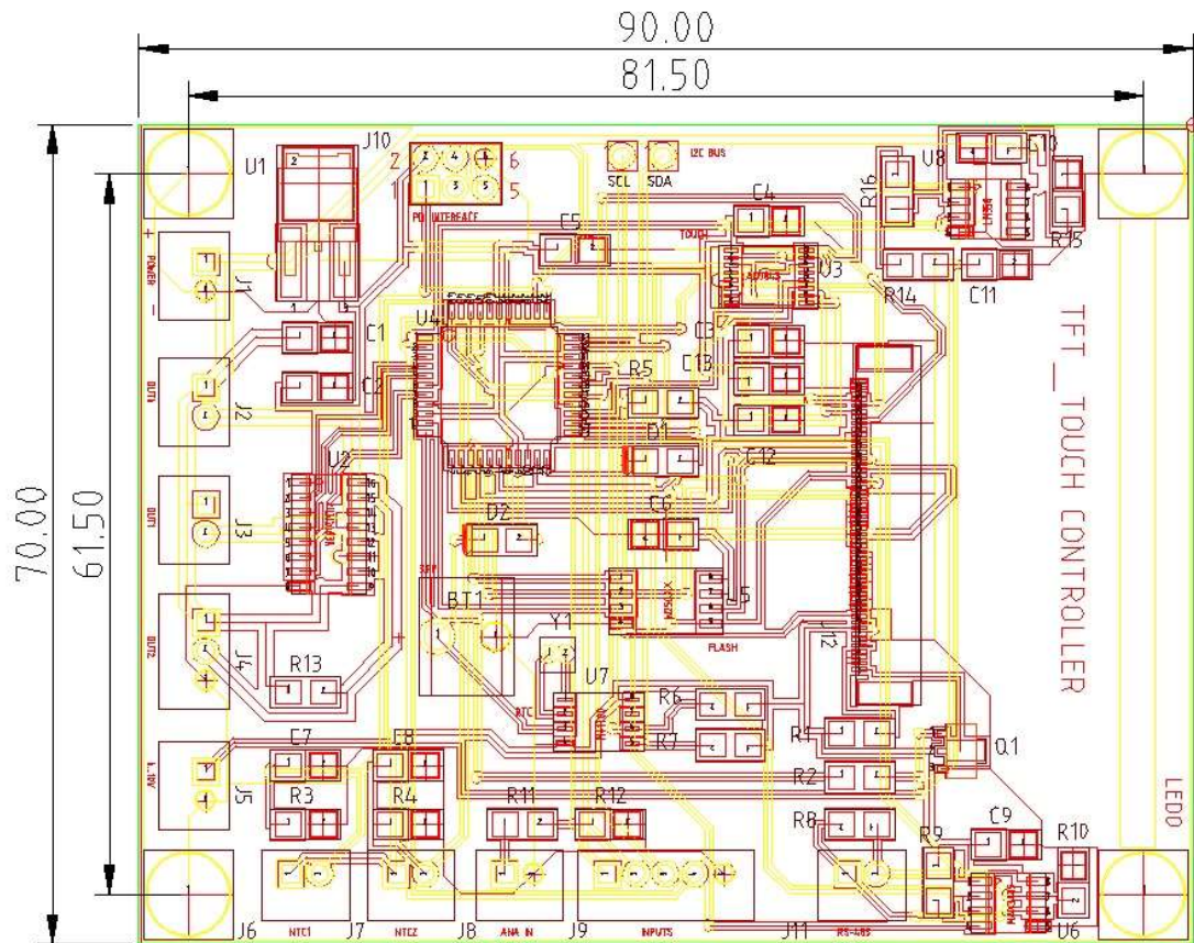
Fig.4. Medidas de la placa